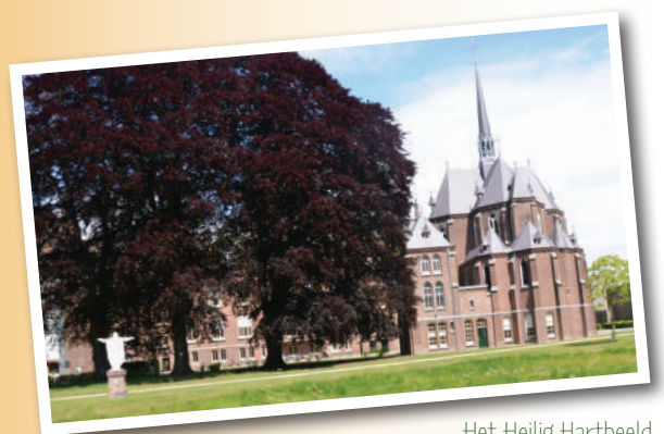
Het Heilig Hartbeeld aan de achterkant van het klooster steekt mooi af tegen de bruine beuken.

Toen de Rooi Harten naar Nederland kwamen, trokken ze in Huize Gerra in Haaren. Huize Gerra kun je zien liggen lang de weg van Tilburg maar Den Bosch, bezijden de toegang tot het voormalig grootseminarie - waar Peerke Donders nog heeft gestudeerd. Toen dit voor bisschop Zwijsen gebouwd kasteelachtig huis te klein werd voor de Rooi Harten vertrokken ze naar Tilburg waar ze in 1882 een oude lakenfabriek kochten in de wijk Veldhoven. De fabriek werd verbouwd tot tijdelijk klooster. De kapel werd ondergebracht in de voormalige machinekamer van de fabriek.