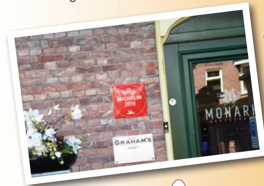
De bescheiden entree van het eerste sterrenrestaurant van Tilburg

De 703 mannen die ooit als jonge jongens voor de eerste keer bij de Rooi Harten aanklopten, gingen door de monumentale deur in het centrum van de kloostergevel naar binnen. Via deze deur verlieten ze het pand om de wijde wereld in te trekken. Nu geeft deze deur toegang tot enkele tientallen appartementen in het vroegere klooster. De krappe ruimte tussen de gevel en het monumentale hek aan de straatzijde staat vol met auto's. Het zijn er zoveel dat ze bijna de toegang tot het eerste restaurant ooit in Tilburg met een Michelinster aan het oog onttrekken. Het rode bordje met daarop één ster zit links van de deur, bescheiden op de hoek van het gebouw. Sterrenrestaurant Monarh begon in 2013 in de voormalige keuken van de Rooi Harten.