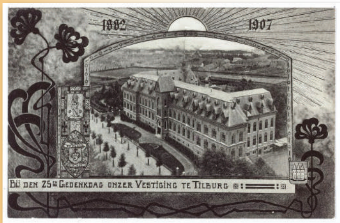
▲ Een herinnering aan 25 jaar Rooi Harten in Tilburg. Rechts onder het oude gemeentewapen van Tilburg. Links in het midden het kenmerkende ovaal dat de Rooi Harten destijds op hun pij ter hoogte van het hart droegen. Waar het nu bomvol met auto's staat, lag toen een groene border aan de rand van de Bredaseweg.