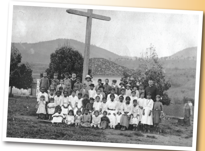
Een missiepost in 1930 in Brazilië.

De Rooie Harten was geen congregatie voor watjes. De Tilburgers lieten zich niet onbetuigd. In totaal zijn er 115 Tilburgse paters en broeders van de Rooi Harten geweest van wie er nu nog vier in leven zijn.