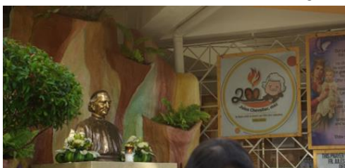
Beeld Chevalier ingang kerk Lapu-Lapu-City

Ik bezocht met mijn groep de kerk van Onze Lieve Vrouw van het Heilig Hart in Lapu-Lapu-City.