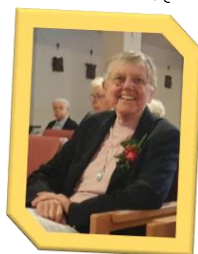
Zr. An 60 jaar geprofest