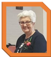
Zr. Fidelis 60 jaar geprofest